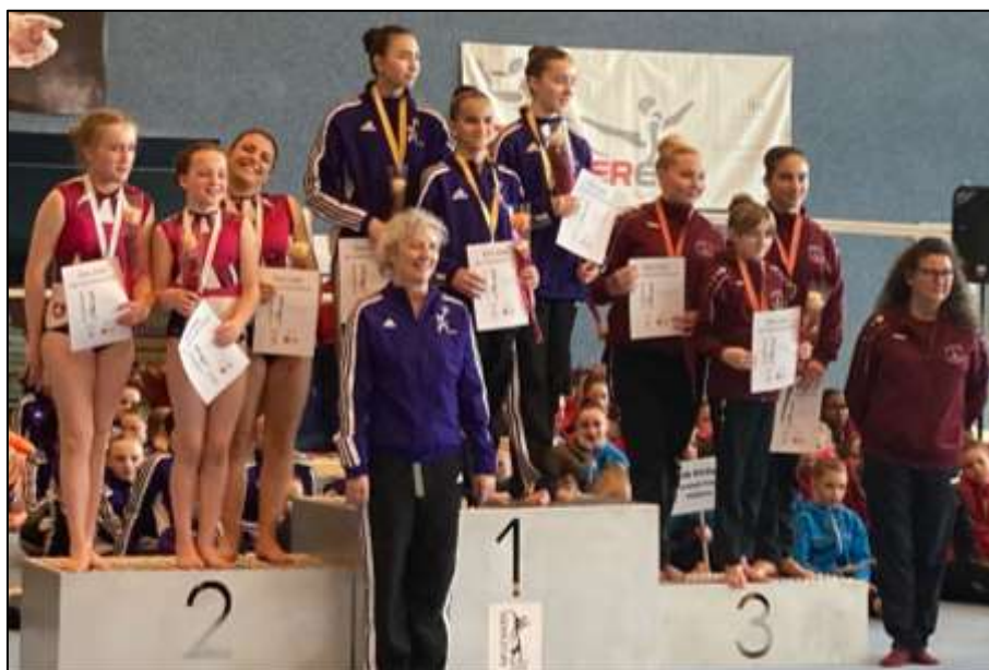
Cat. FSGA SD3 - trios des Eaux-Vives et de Plan-les-Ouates

La délégation reviendra les bras chargés de médailles avec 18 podiums dont 8 premiers rangs.