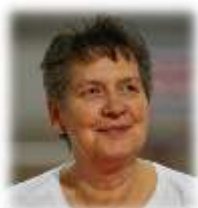
Division Technique sport de Masse (jusqu'à juin 2023)