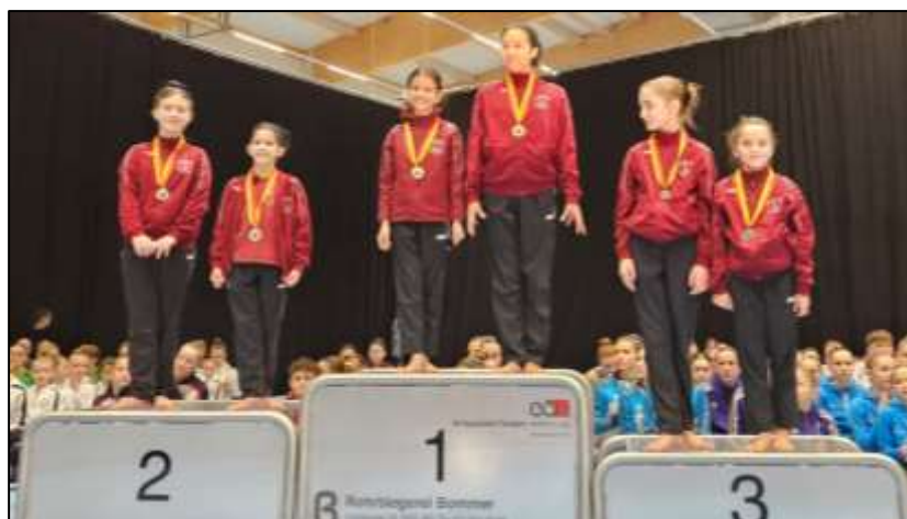
Cat. FSGA SN1 / W2 – les 3 duos de Plan-les-Ouates

Ce sont 18 groupes du CCE, des Eaux-Vives et de Plan-les-Ouates qui sont partis représenter Genève à Saint-Gall pour la deuxième compétition de la saison. Quatorze groupes sont montés sur les podiums en obtenant 9 premières places, 2 deuxièmes places et 3 troisièmes places. D'excellentes performances qui annoncent une belle année 2024.