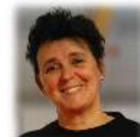
Division Technique sport d'Elite