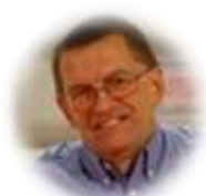
Division Technique sport de Masse a.i.