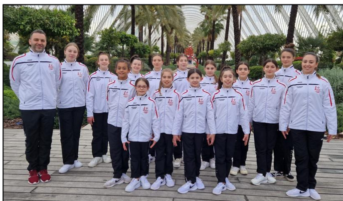
Délégation du CCE

Des entraîneurs et des parents heureux des résultats des gymnastes.