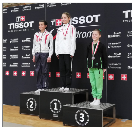
Adénon 1 ère en U13 National