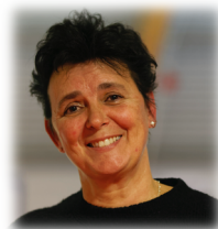
Division Technique sport d'Elite