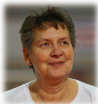
Division Technique sport de Masse