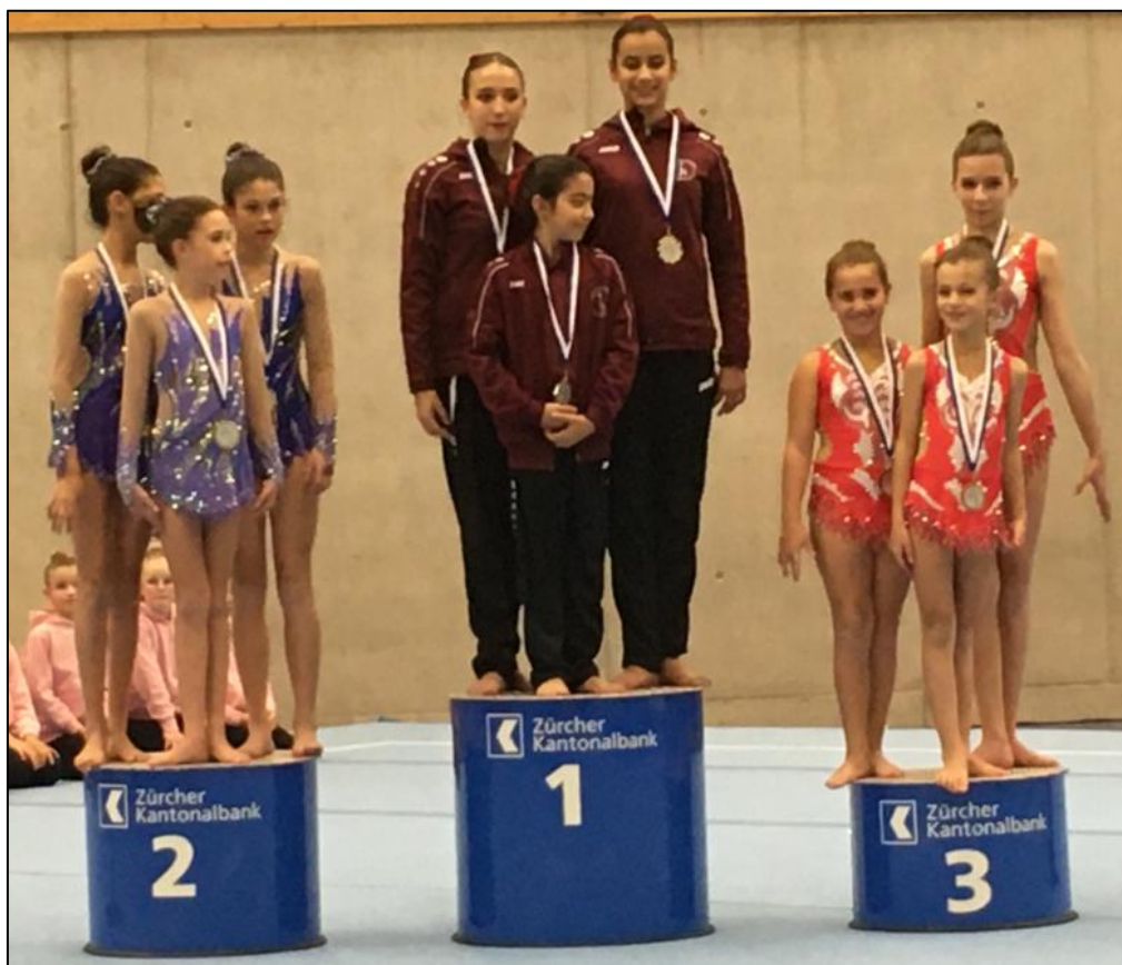
Cat. SN1 trio